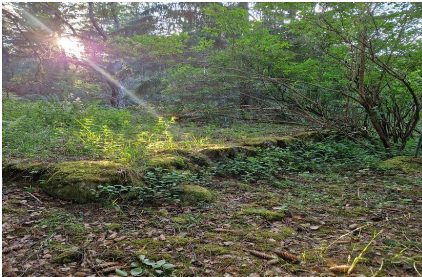
Stenfot från Lilla Mabo.